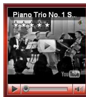
Yehudi Menuhin, Maurice Gendron e Hepzibah Menuhin Piano Trio N° 1 Schubert

A crise não foi nem marolinha, nem tsunami, mas ressaca tão forte quanto passageira. Do estouro da crise lá fora em 15 de setembro de 2008 até a chegada nas séries da PME demorou três meses e meio, defasagem similar ao da chegada da crise asiática de setembro de 1997 às mesmas séries. A diferença é que o efeito da última persistiu por cinco anos em nossas séries e o da crise recente começou a ser revertido um mês depois. Mas o que explica a retomada recente? Não foi a média de renda per capita que sobe 0,9% nos