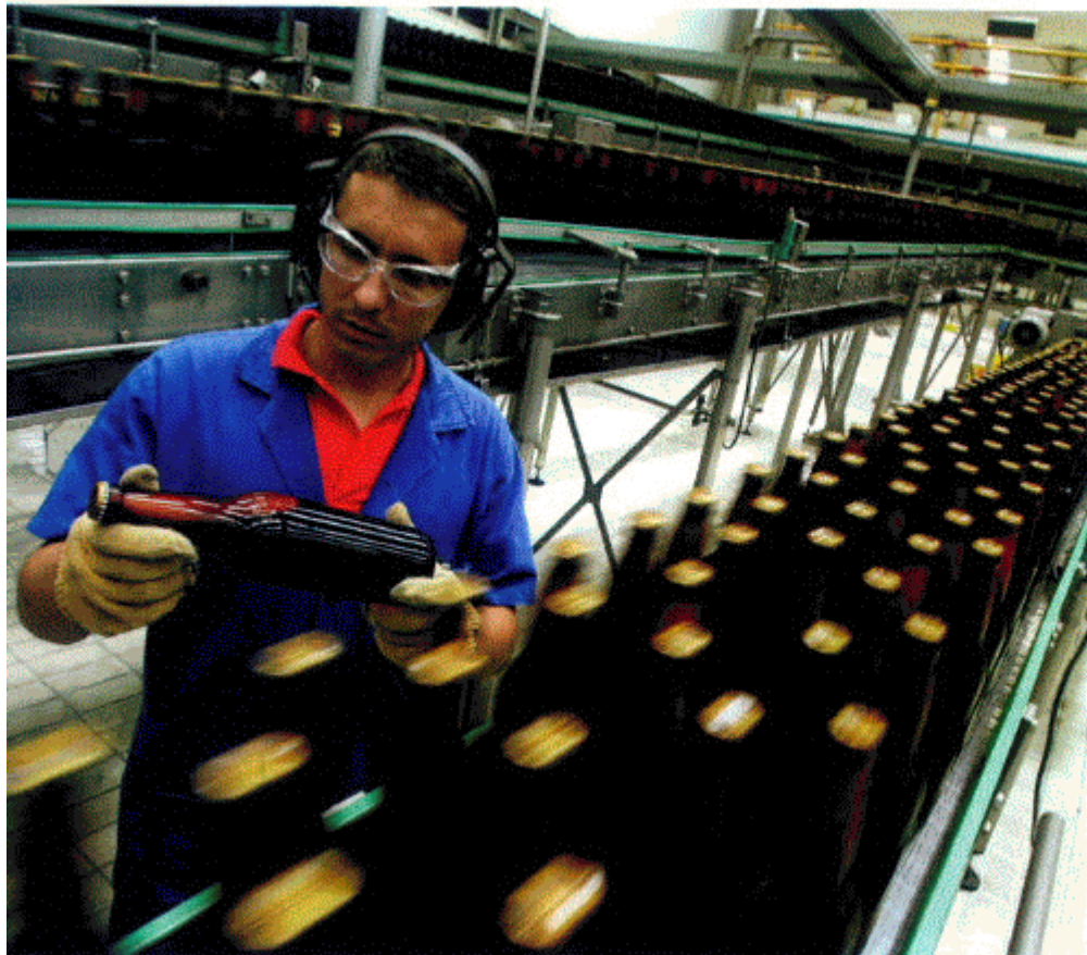
Cadeia. A alta do consumo também beneficia as grandes indústrias

foram feitos diversos avanços, como a legislação que permite que 2% dos depósitos compulsórios dos bancos sejam direcionados ao segmento, mas a taxa de juro ainda é elevada. Menos de 10% dos micronegócios no Brasil têm acesso a crédito. O microcrédito ainda está andando devagar, mas talvez decole. Em geral, o setor privado não criou uma cultura por estar ainda muito atrás no balcão. Há também uma insistência em negociações pequenas com operadores pequenos, como ONGs. E os bancos públicos, em sua maioria, ainda poderiam ter um papel relevante para reduzir o juro na ponta do tomador. O microcrédito ainda não chegou à classe E, está chegando a uma velocidade lenta para quem tem o Bolsa Família.