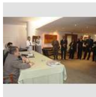
Assinatura do protocolo de intenções e o contrato para realização de um seminário sobre etanol