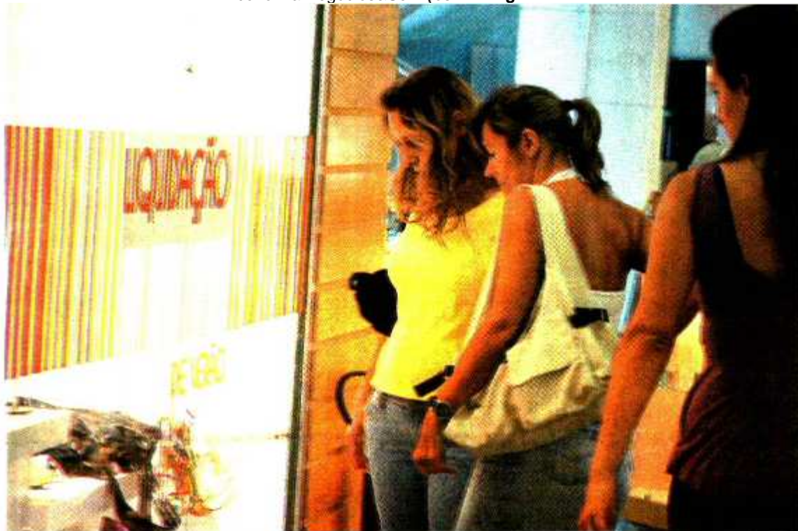
MOTOR – Parcela da população que vive no limite da capacidade financeira movimentava economia