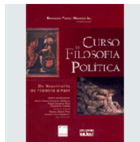
Curso de filosofia política

No dia 29 de setembro serão selecionados os três vencedores de cada categoria, que serão premiados com o troféu no dia 4 de novembro, em cerimônia na Sala São Paulo.