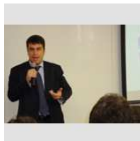
Secretário Municipal de Ordem Pública Rodrigo Bethlem

O Centro Acadêmico de Sociologia, Política e Antropologia, da Graduação em Ciências Sociais da FGV, recebeu na quarta-feira, 26 de agosto, o secretário municipal de Ordem Pública, Rodrigo Bethlem, para um debate sobre o Choque de Ordem e suas implicações no sistema urbano. O secretário proferiu palestra e respondeu a perguntas feitas pelos presentes.