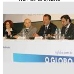
Colunista de O Globo Míriam Leitão, ministro da Fazenda Guido Mantega, governador Sérgio Cabral, do Rio, e Aécio Neves, de Minas Gerais.