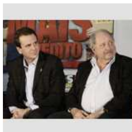
Prefeito Eduardo Paes e Roberto Smith, Presidente do BNB na expansão do Crediamigo na Maré

Acesse a pesquisa na íntegra através do site www.fgv.br/cps/crediamigo3 , onde além do estudo, você encontra dispositivos interativos de acesso a diversas bases de dados e vídeos com entrevistas a clientes do programa.