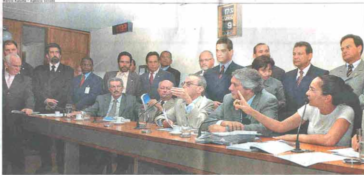
IMPASSE Líderes do Governo e da oposição decidiram adiar a escolha de ocupantes da CPI dos Correios