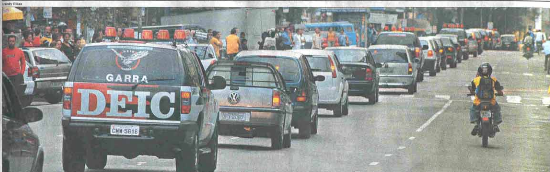
COMBOIO Mais de 60 veículos, computadores, documentos e cheques, apreendidos em Santos, foram levados pela Polícia Civil ontem pela manhã para São Paulo

SANTOS SEXTA-FEIRA 10 DE JUNHO DE 2005 ANO 112 Nº R$ 1,50