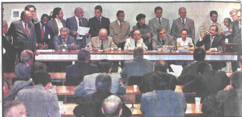
Senador Agripino Maia (PFL-RN), à direita na mesa, insiste em César Borges (PFL-BA) para relator e acusa governo de querer indicar representantes da oposição na com