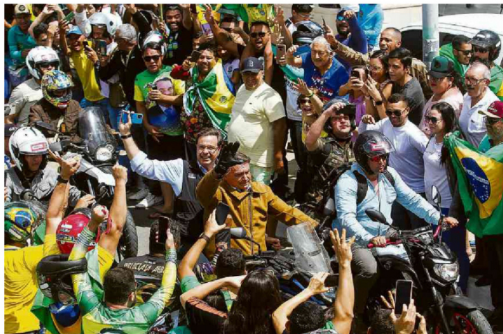
Bolsonaro participa de motociata em Santa Cruz do Capibaribe (PB) em setembro.