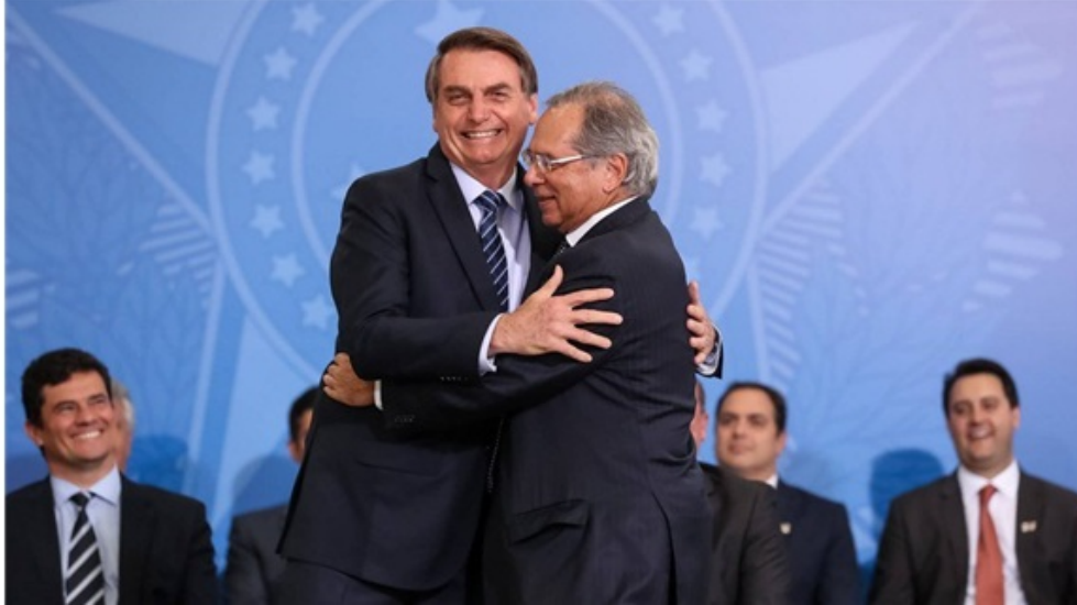
Marcos Corrêa/PR – 29.8.19 Somente em 2003 o Brasil conviveu um índice de inflação tão alto como agora