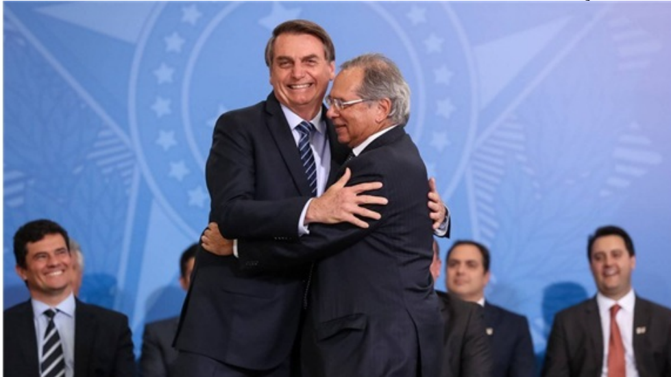
Marcos Corrêa/PR – 29.8.19 Somente em 2003 o Brasil conviveu um índice de inflação tão alto como agora