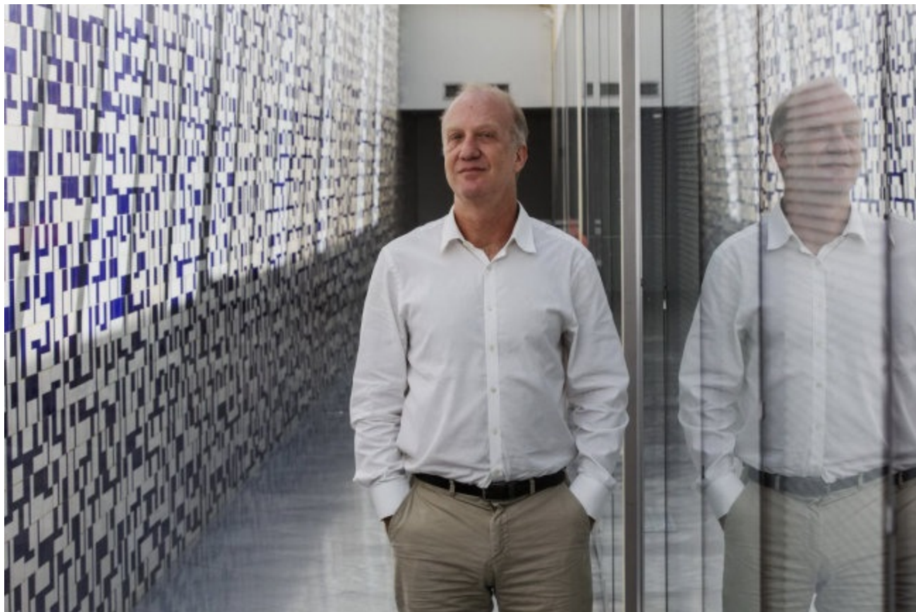
Marcelo Neri, economista e diretor do FGV Social, em foto de 2019

“A Olimpíada fez a diferença, teve uma contribuição para manter as rodas da economia girando. O problema é que, depois disso, o Rio voltou a decair. A informalidade aumentou no mercado de trabalho, houve uma série de inflexões”, completa.