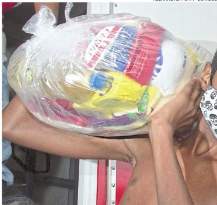
PBH fez doação de cestas básicas e kits de higiene na capital