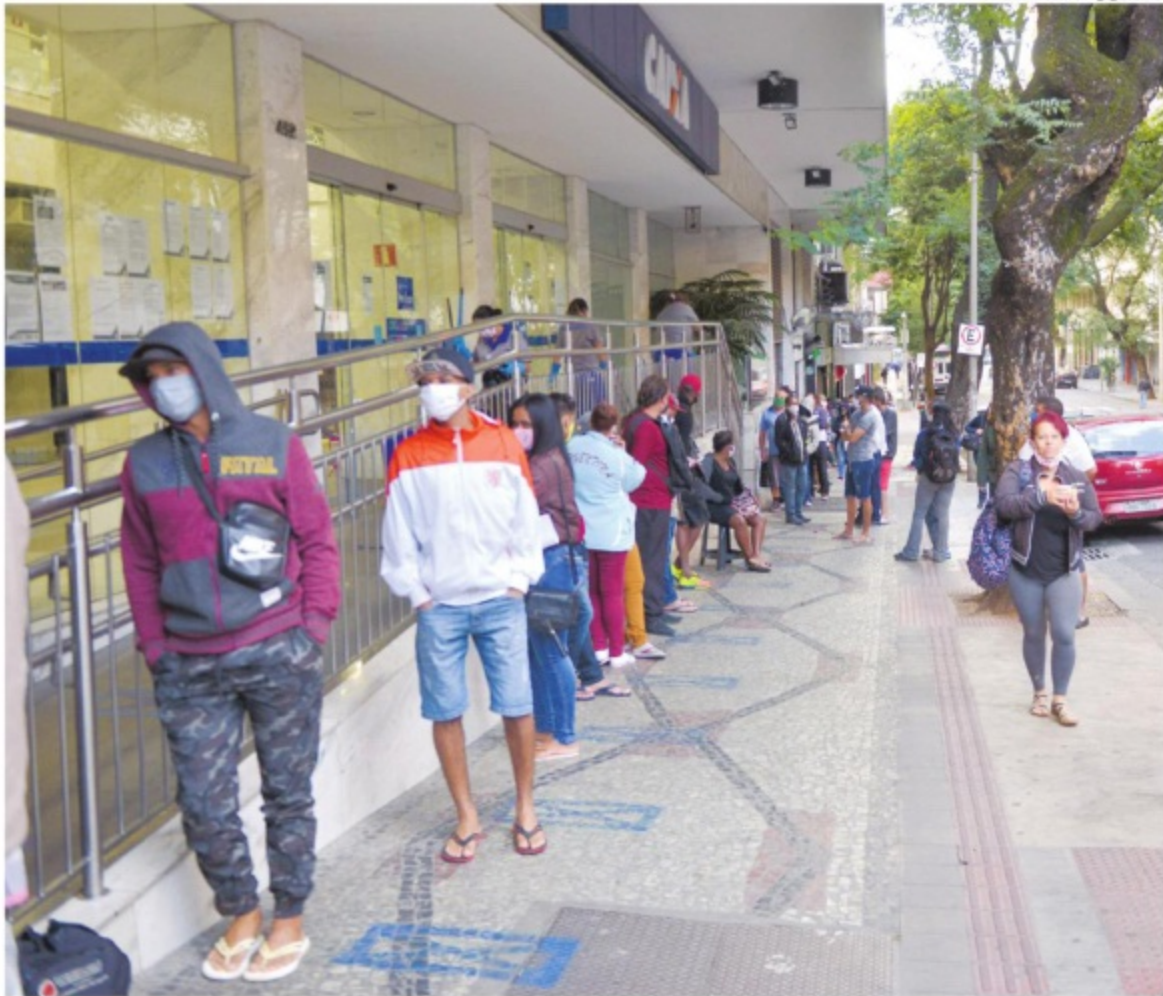
Recursos. Beneficiários enfrentam filas na Caixa durante pagamento do auxílio emergencial