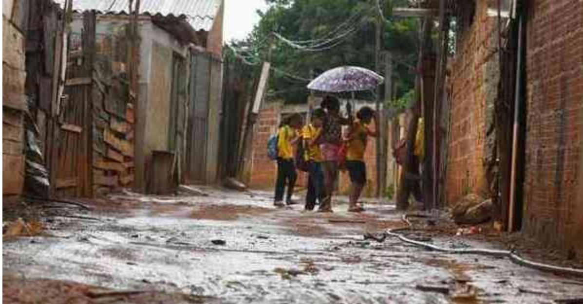
Condições socioeconômicas precárias do país serão mais impactantes do que a questão etária, preveem especialistas