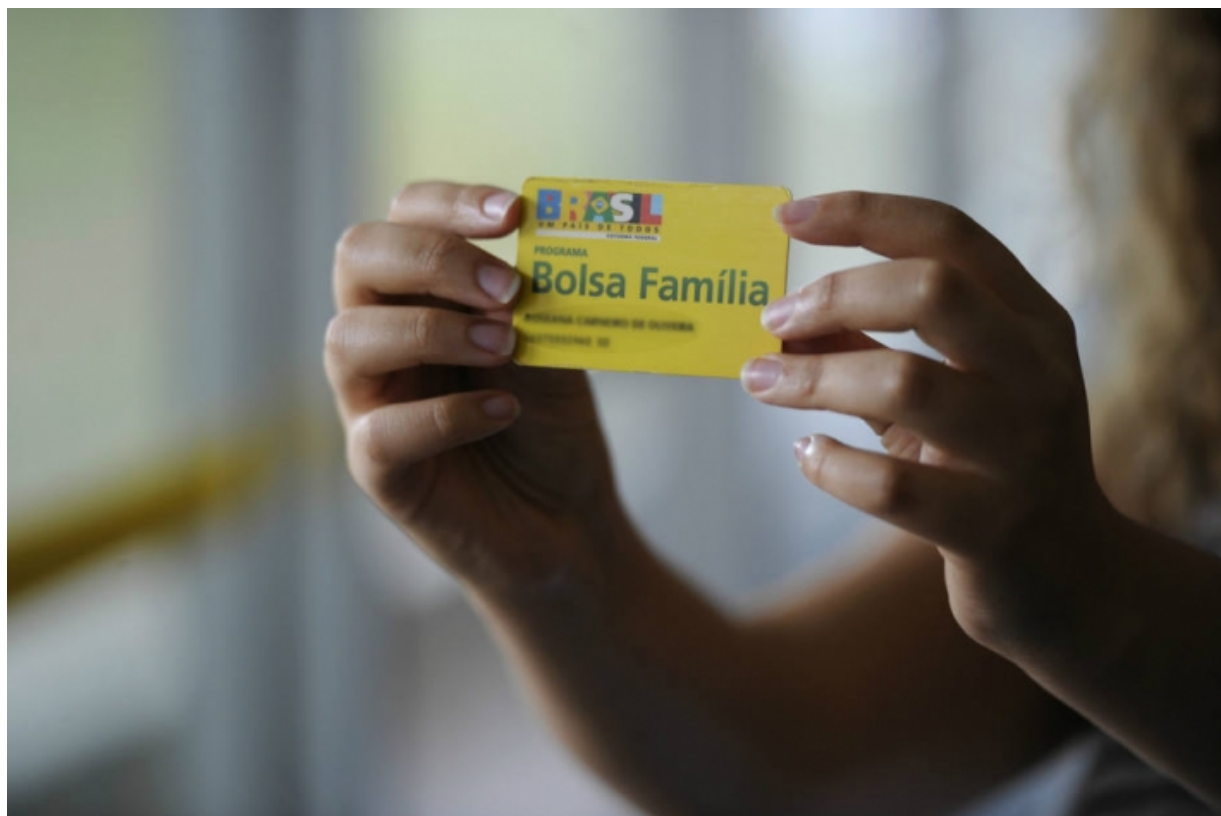
Bolsa Família é recebido por 14,1 milhões de brasileiros

Hoje, têm direito ao Bolsa Família as famílias em situação de pobreza e de extrema pobreza, caracterizadas pela renda familiar mensal per capita [por pessoa] de até R$ 178 e R$ 89, respectivamente, diz o artigo 18 do decreto que regulamenta a lei que cria o programa.