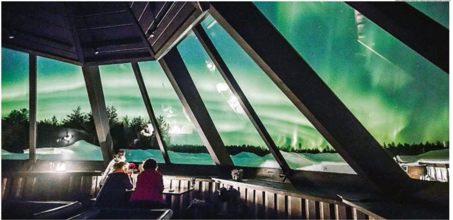
Satisfeitos. Finlandeses são pela segunda vez consecutiva campeões do ranking global de felicidade, que leva em consideração aspectos econômicos e subjetivos; na foto, Aurora Boreal vista pelas janelas de um hotel na cidade de Rovaniemi