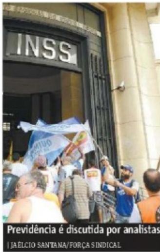
Previdência é discutida por analistas

Segundo a projeção do IBGE, a população brasileira – hoje em 208,5 milhões – crescerá em ritmo cada vez mais lento pelos próximos 30 anos e chegará ao ápice em 2047: seremos 233,23 milhões. A partir desse ano, se a estimativa se confirmar, o número de mortes no país superará o de nascimentos, e passaremos a perder habitantes.