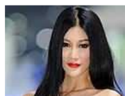
Belleza sobre ruedas Las chicas del Autoshow de Beijing