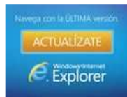
Internet Explorer 9 Cámbiate y descubre lo mejor de Internet, ahora más rápido