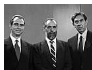
Debate electoral Frasas y curiosidades de los enfrentamientos