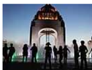
Colores del Mundo Una mirada única al planeta