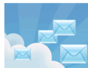
Hotmail Mantente siempre en comunicación con tus amigos y seres queridos...