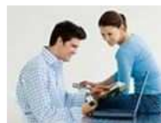
Clic inteligente Los mejores consejos para navegar protegido por la red