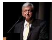
Elección 2012 Todo lo que ocurre en el proceso electoral