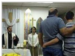
"Feligreses homosexuales en iglesia." Vargas (FGV) en Río de Janeiro.

Compartir 2 | Twittear < 0 | Me gusta < 1