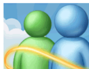
Messenger Platica con tus amigos y seres queridos, comparte fotos, videos y mucho más...