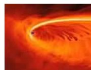
Imágenes únicas Las mejores fotografías de la NASA