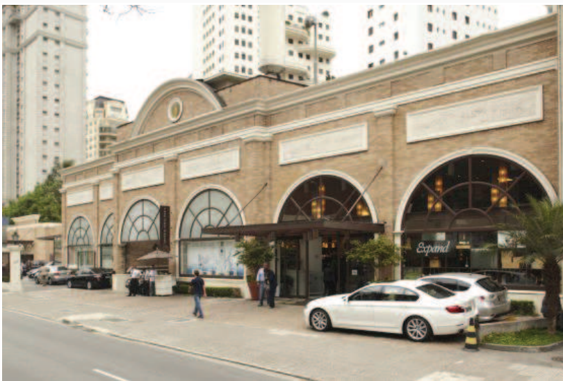
Una exclusiva tienda de delicatessen en Sao Paulo.

30 millones de personas han entrado en la horquilla de ingresos entre los 700 y 3.000 euros al mes. El crecimiento ha expandido el mercado interno y disparado los precios de la vivienda.