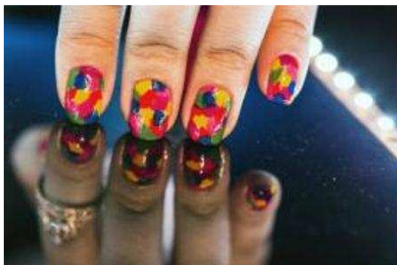
Sơn vẽ móng tay, sử dụng nước hoa và trang điểm hoàn hảo là những điều bắt buộc phải có đối với phụ nữ tại Brazil.

Khoảng 40 triệu người đã gia nhập tầng lớp trung lưu trong thập kỷ qua tại đất nước Mỹ Latin, hiện là nền kinh tế lớn thứ sáu thế giới này và các nhà bán lẻ các sản phẩm chăm sóc sắc đẹp nhìn thấy các cơ hội cho doanh số bán hàng lớn.