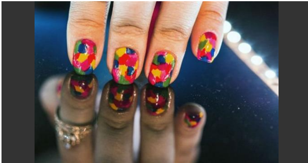
Une femme montre ses ongles lors de la "Nails Fashion Week" (Semaine de la mode des ongles), le 6 août 2012 à Sao Paulo