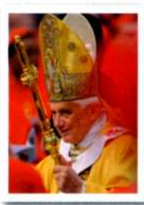
LINHA DURA Bento XVI recrudescer a disciplina, para manter a coerência da doutrina