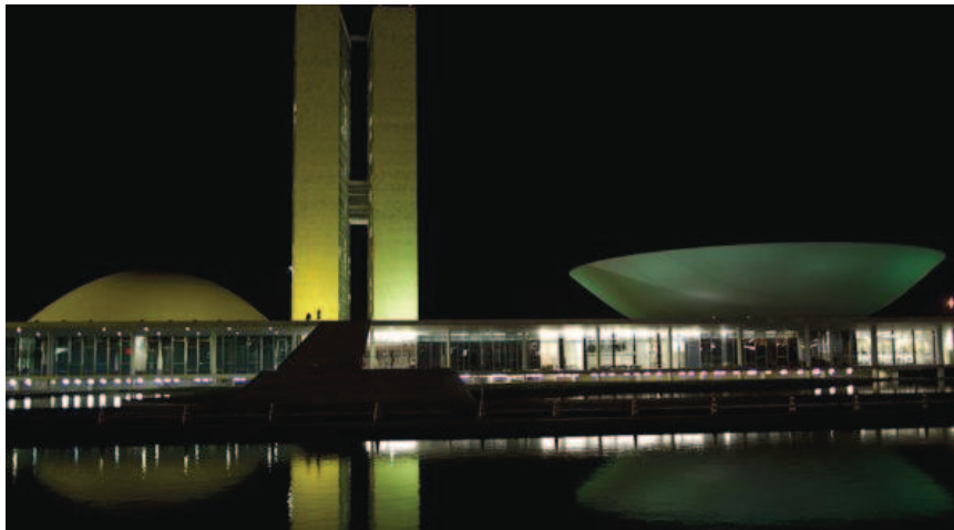
- L'Assemblée nationale, à Brasilia, le 16 septembre 2011. -

Pour éviter de subir les effets collatéraux d'une éventuelle nouvelle récession mondiale, le Brésil a proposé aux autres grands pays émergents de donner un coup de main financier à l'Europe. L'initiative n'a pas rencontré beaucoup d'échos mais atteste de la santé du Brésil et de ses ambitions sur la scène internationale.