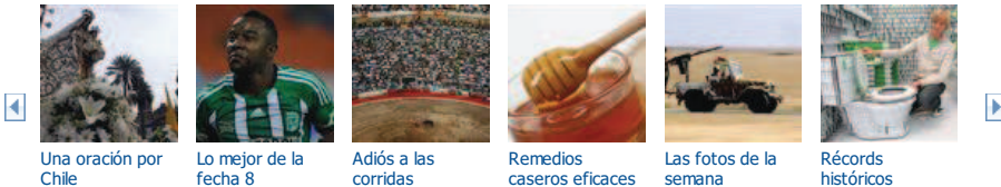
Una oración por Chile