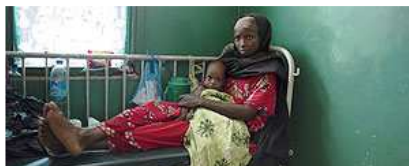
Cerca de la mitad de la población somali está en una situación crítica