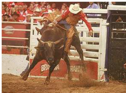
Vea la Fiesta del Peón en Barretos (SP)