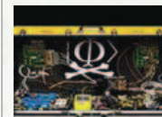
Así fue vulnerado el sistema de cifrado "invencible"