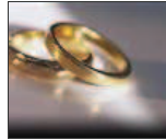
El matrimonio mil entre personas del mismo sexo