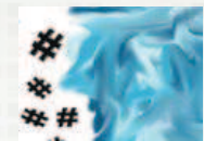
El arte de la sucinta #