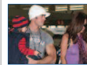
William Levy se ha reconciliado y se casará con Elizabeth Gutiérrez