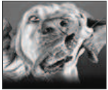
Perros haciendo gestos graciosos