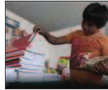
Las claves para deducir las colegiaturas