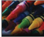
Los colores no existen