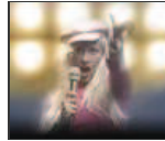
Explican economía con hip hop