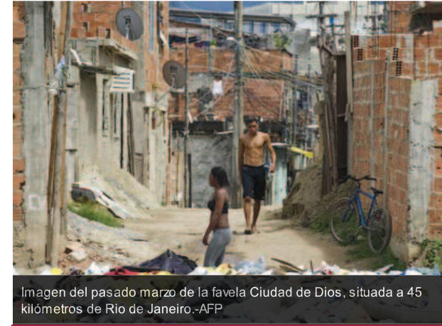
Imagen del pasado marzo de la favela Ciudad de Dios, situada a 45 kilómetros de Río de Janeiro.

"País rico es país sin pobres", dice el logotipo del Gobierno de la presidenta brasileña