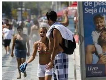
La playa de Ipanema