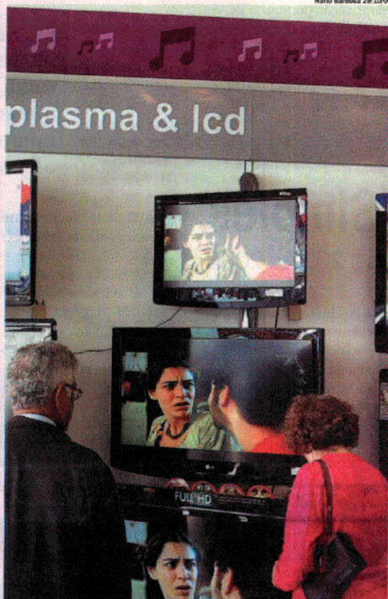
Número de pessoas da classe C com TV subiu mais de dez pontos percentuais desde 1992