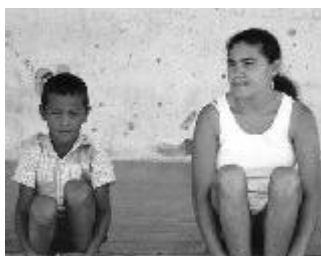
El perfil de las madres jóvenes difiere bastante del perfil de las madres de mediana edad.

De acuerdo a datos recogidos en el año 2003, la pobreza y la densidad demográfica son factores determinantes en la tasa de fecundidad entre las mujeres brasileñas. La conclusión surge de un estudio realizado por la Fundación Getulio Vargas (FGV): Perfil de las madres brasileñas.