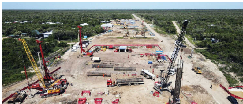
Mercadante presidente do BNDES População de Mato Grosso do Sul tem a oitava maior renda média do Brasil