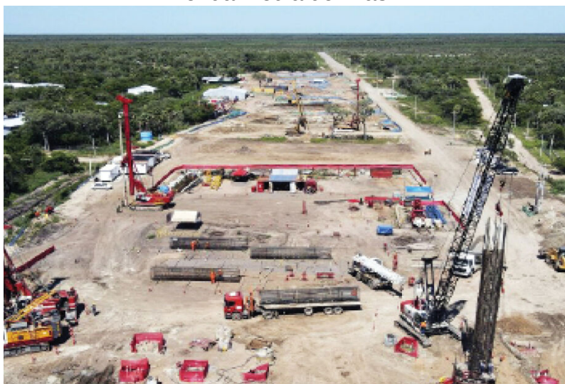
Mercadante presidente do BNDES População de Mato Grosso do Sul tem a oitava maior renda média do Brasil