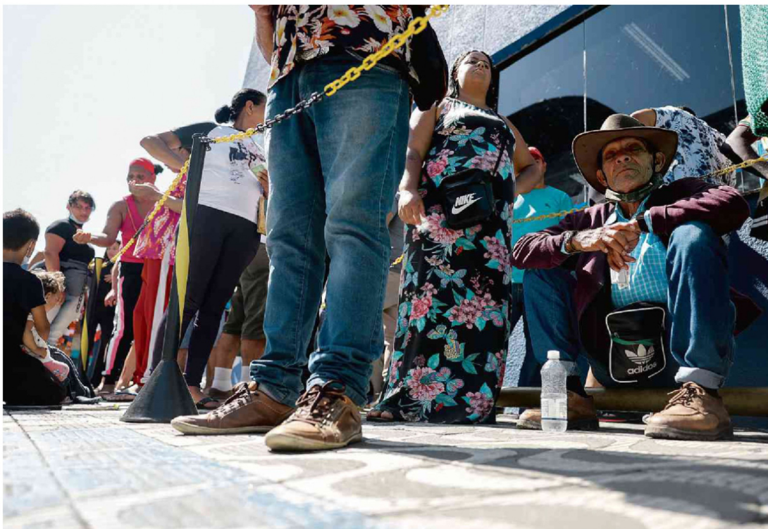
Agência da Caixa da avenida Sapopemba, na zona leste de São Paulo, durante primeiro dia de pagamento do novo Bolsa Família 20.mar.2023