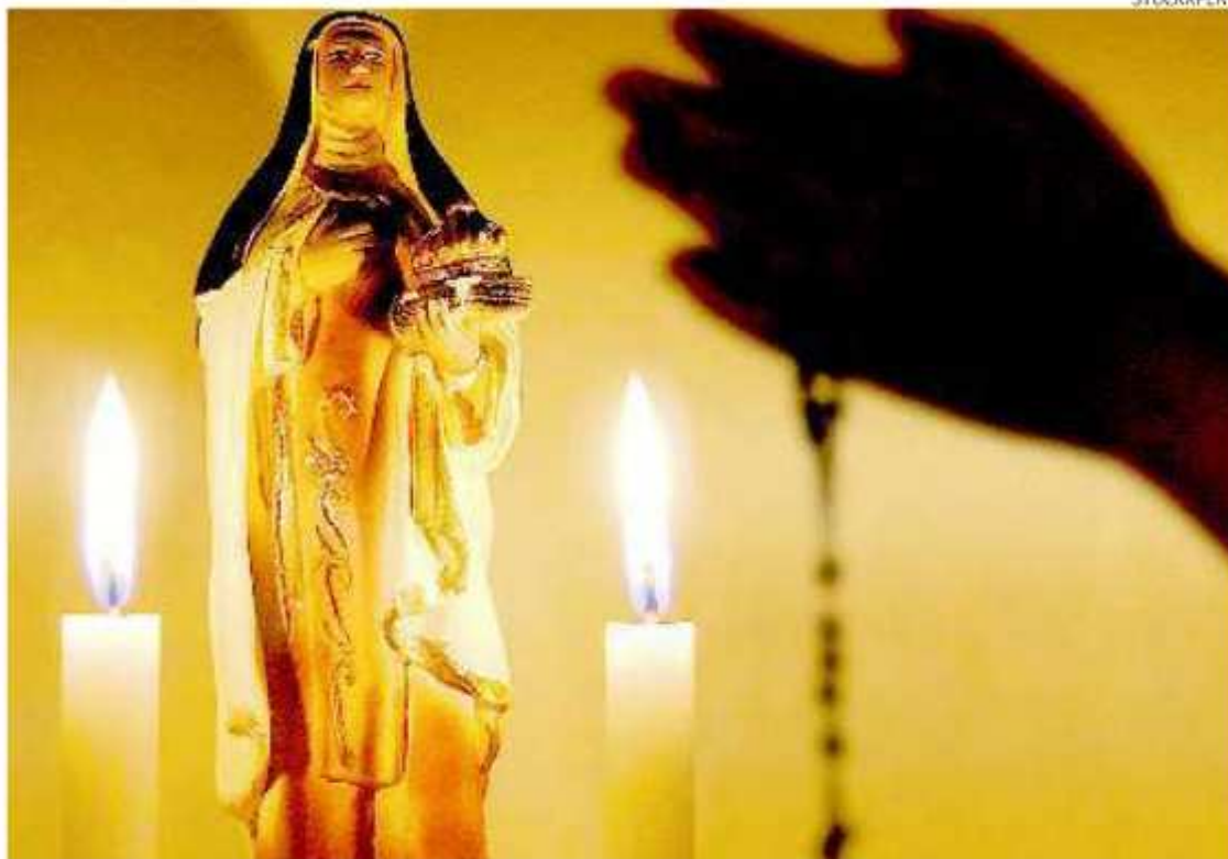
Evolução. Mapa das Religiões aponta que a redução de católicos se acentuou nos últimos 30 anos